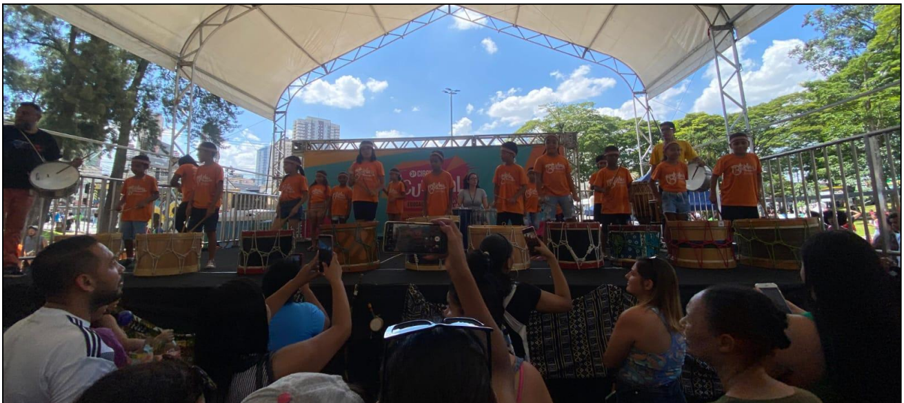
Turma Formiga do Átila

No dia 02 de dezembro a ACER Brasil junto com as crianças do Programa Mais Educação, fizeram uma apresentação de percussão no evento chamado Circuito Cultural, que aconteceu na praça da Moça em Diadema. A turma do programa que apresentou foi a formiga da escola EMEB Dr. Átila Ferreira Vaz. A apresentação foi dividida em três momentos, a primeira as crianças do Mais Educação apresentação um do ritmo Samba-reggae, depois os alunos da ACER Brasil apresentaram com a percussão o ritmo Maracatu e por último o Maculelê com a capoeira.