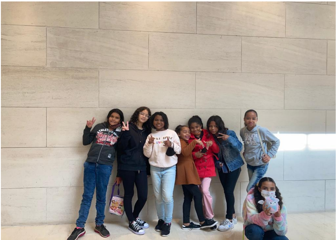
Teatro cultura Inglesa