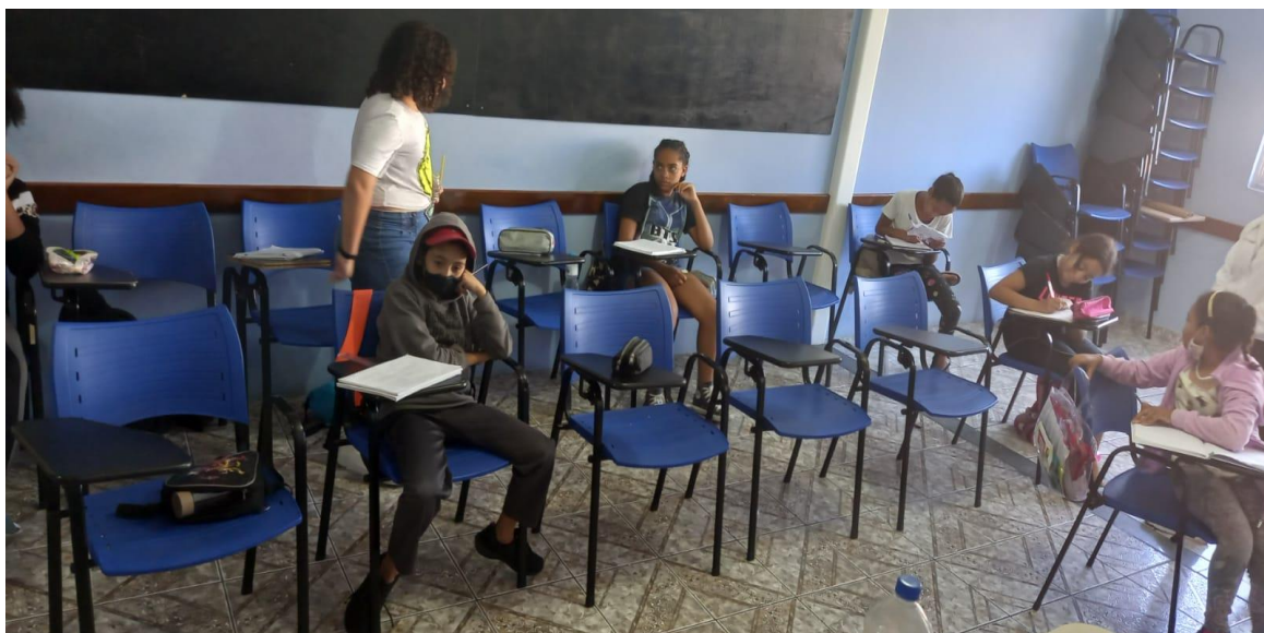
Aulas de apoio Matemática e Português