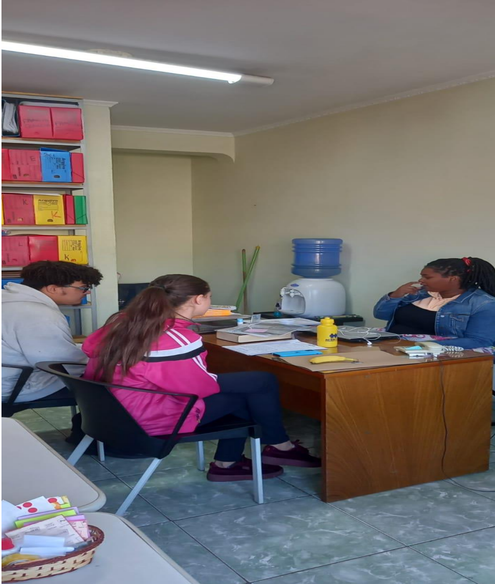
Conversa mensal recepcionista