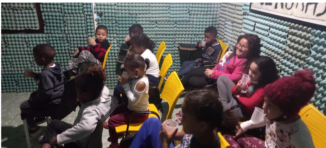
Crianças capoeira turma sábado

Ensinamos algumas músicas e com pouco de dança para as crianças fixa a informação para as crianças.