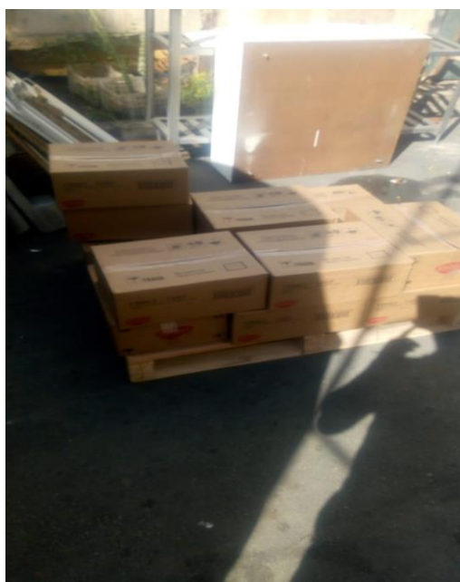
Doações do mês