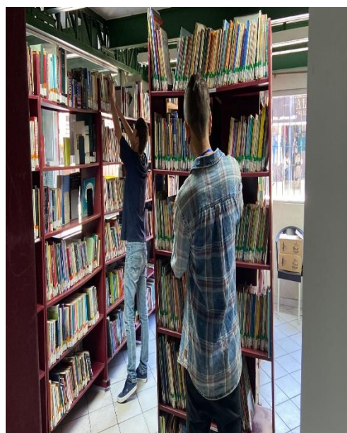
Organização da biblioteca ACER