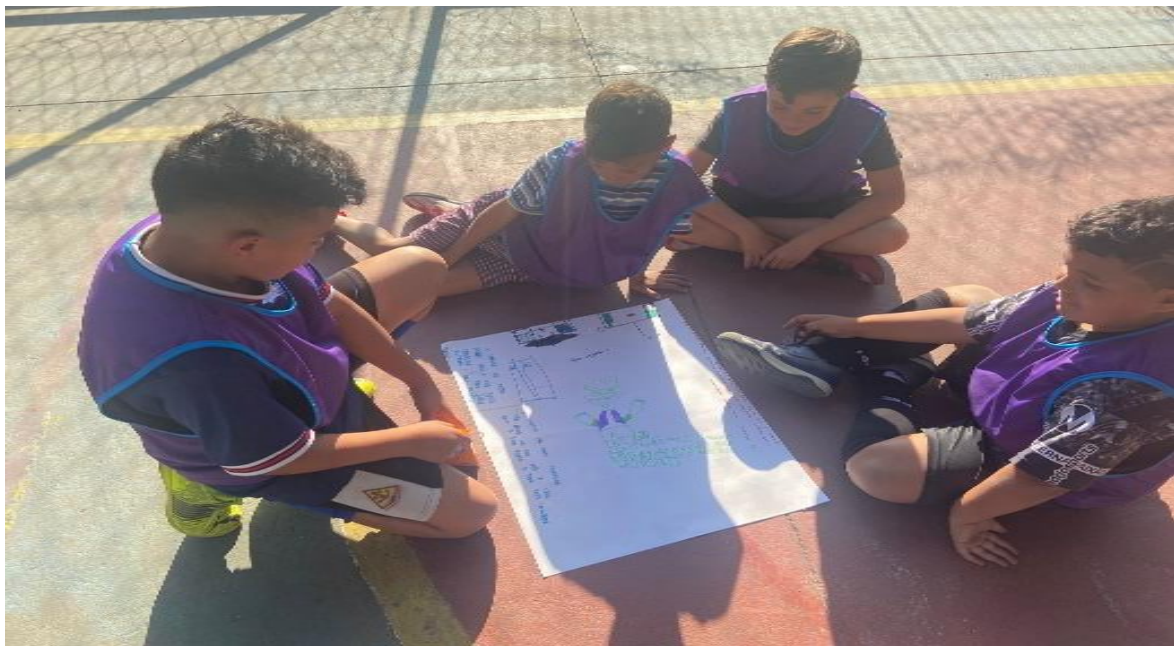
Futsal masculino – tarde