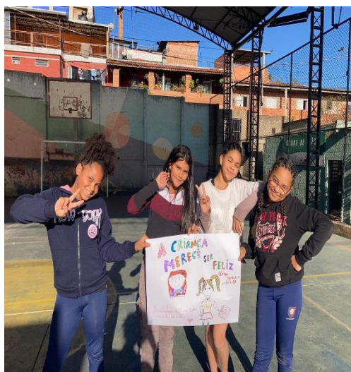
Futsal turma tarde