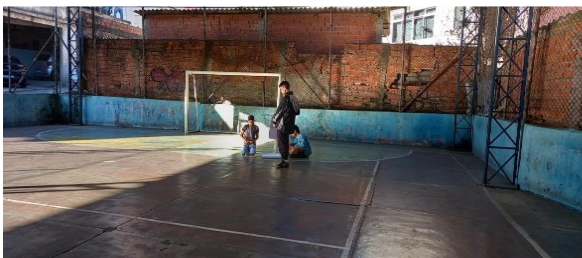
Futsal Masculino primeira turma Manhã