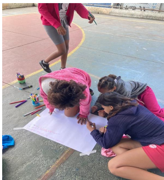
Futsal feminino – Manhã