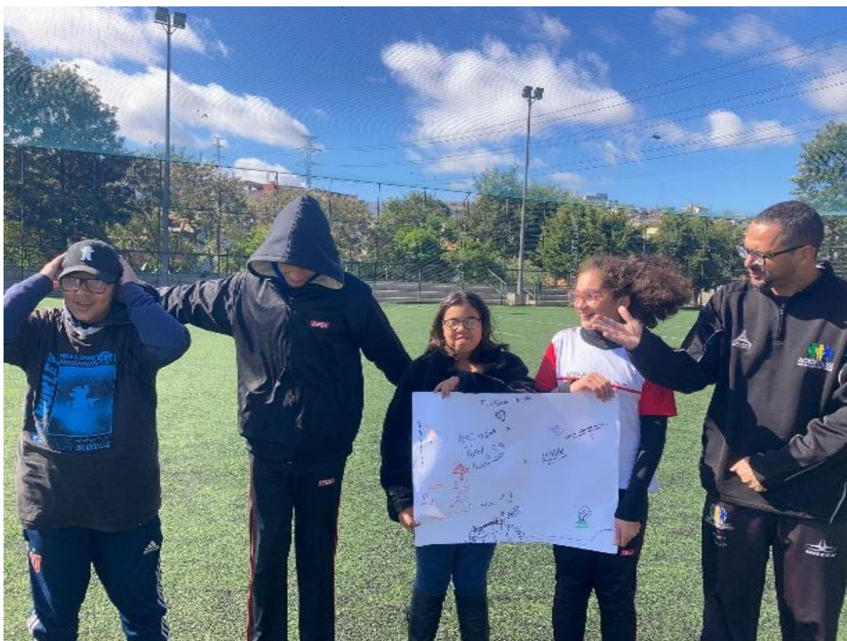
SESI – Diadema