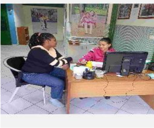
Mentoria com os monitores