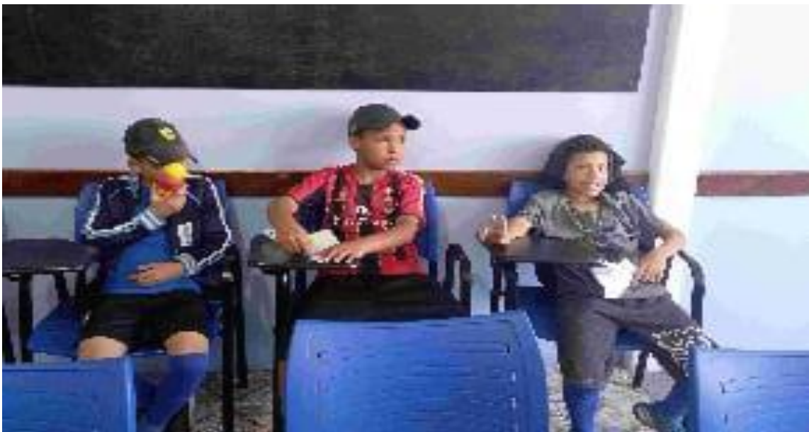
Aulas de reforço