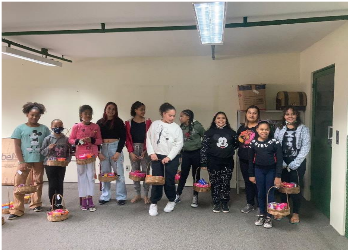
Roda de conversa