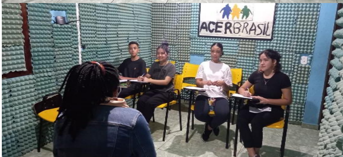
Atividade política de proteção