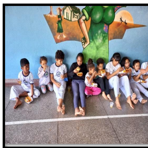
Turma da Capoeira treinos de sábados