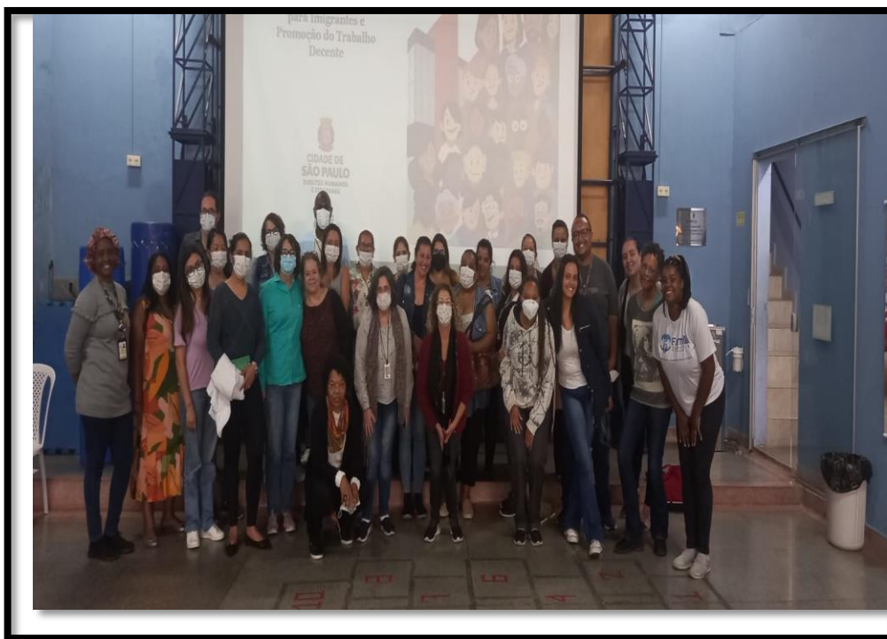
Capacitação dos profissionais do SUS

A partir da parceria com a Secretaria Municipal da Saúde, foi pensado em uma formação de capacitação para os profissionais do SUS- Sistema Único de Saúde, unidades Básicas de Saúde (UBSs) Eldorado e Inamar, equipes de Saúde da Família representantes da ONG ACER Brasil e dos Centros de Referência em Assistência Social (CRAS) da região. A proposta da capacitação foi a construção e implantação da política municipal de saúde voltado à população imigrante ou em situação de refugio