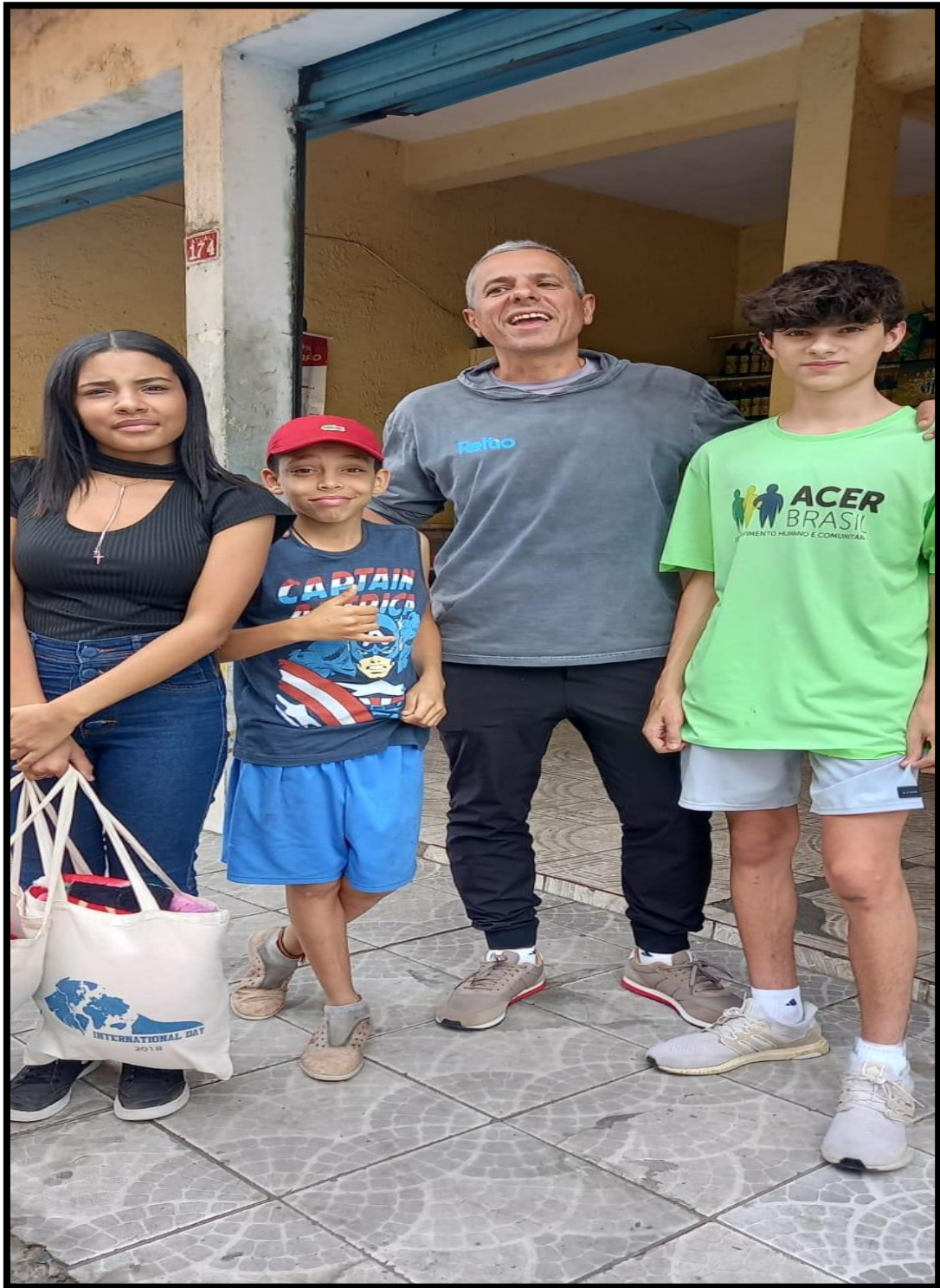
Visita domiciliar – Wellington

Telefones: (011) 4049 1888 ~ 98914 5883 ~ E-mail: info@acerbrasil.org.br ~ Site: www.acerbrasil.org.br