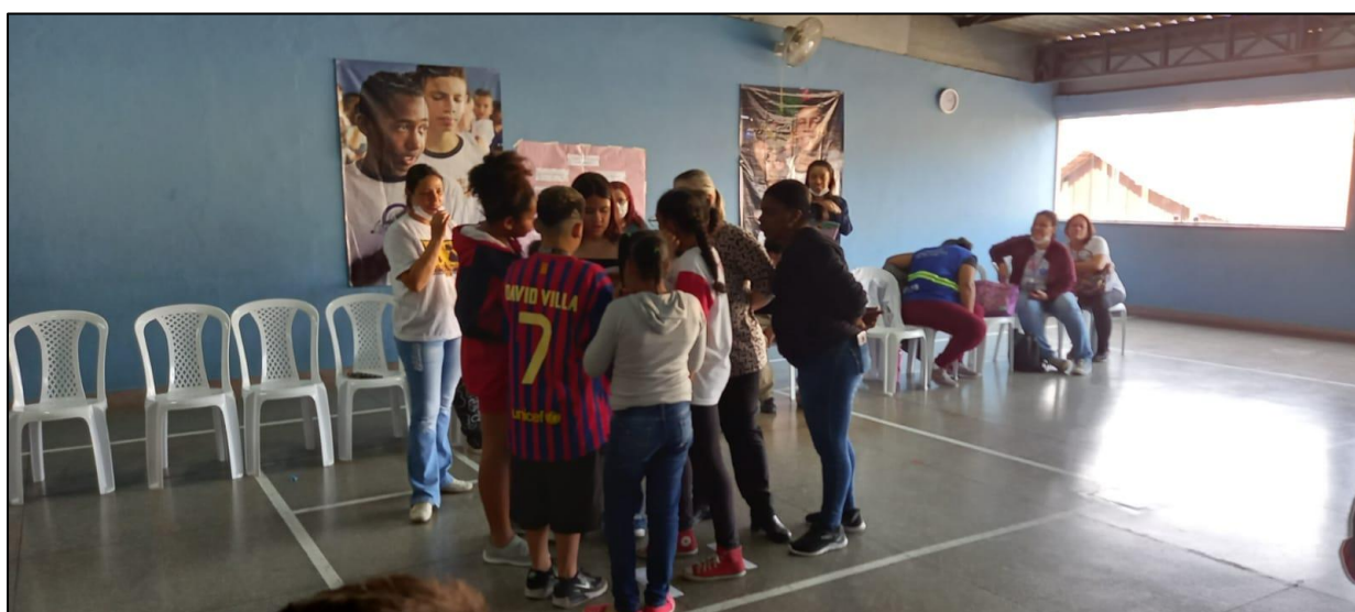
Atividade sobre inteligência emocional