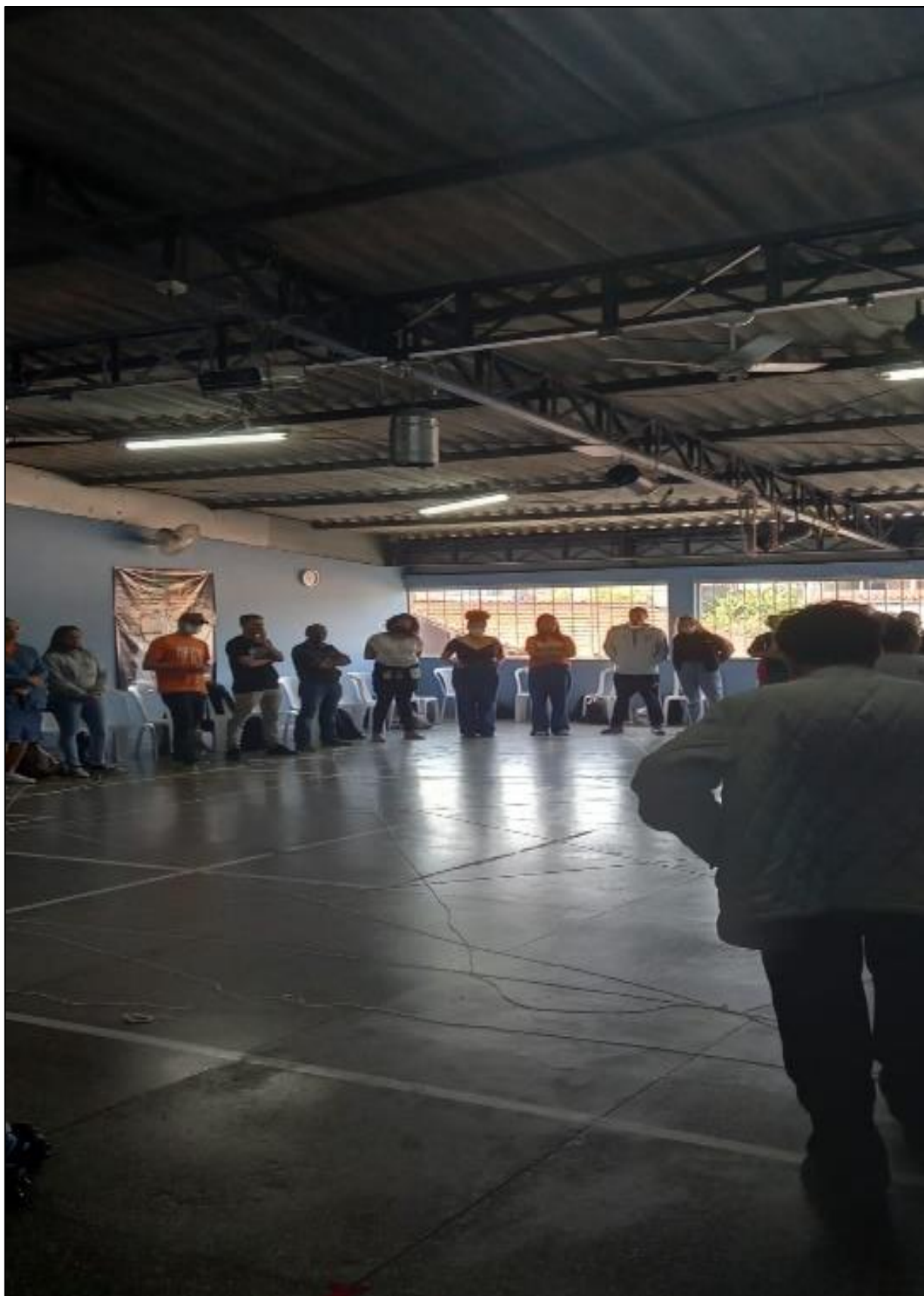
Formação política de proteção mais educação

Telefones: (011) 4049 1888 ~ 98914 5883 ~ E-mail: info@acerbrasil.org.br ~ Site: www.acerbrasil.org.br