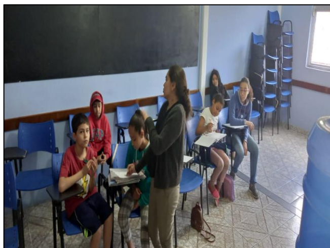
Aulas de reforço