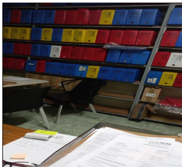
Organização de arquivo