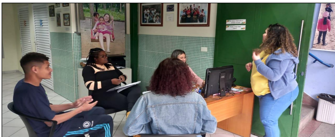
Reunião com os recepcionistas

Sobre os voluntários do Estante do Saber, alinhamos que as informações e necessidade dos mesmo para a manutenção da biblioteca ficaria com a gerente de proteção, para que possamos alinha as falas e melhoramos a comunicação.