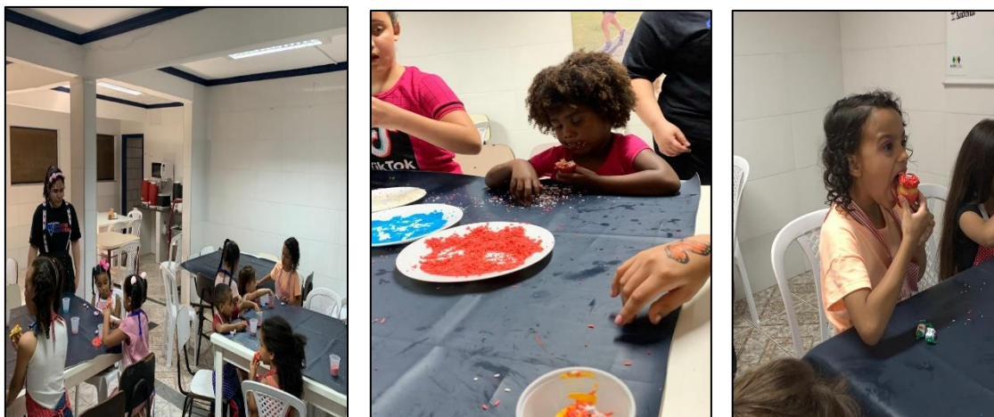
Confeiteiros (a) de cupcakes

Na cozinha atividade foi a confecção dos cupcakes e parte que as crianças amaram foi comer.