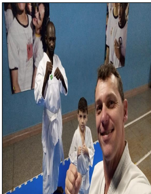
Karatê turma sexta feira