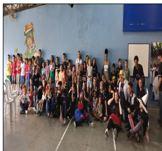
Início da atividade, crianças foram chegando ao longo do tempo.