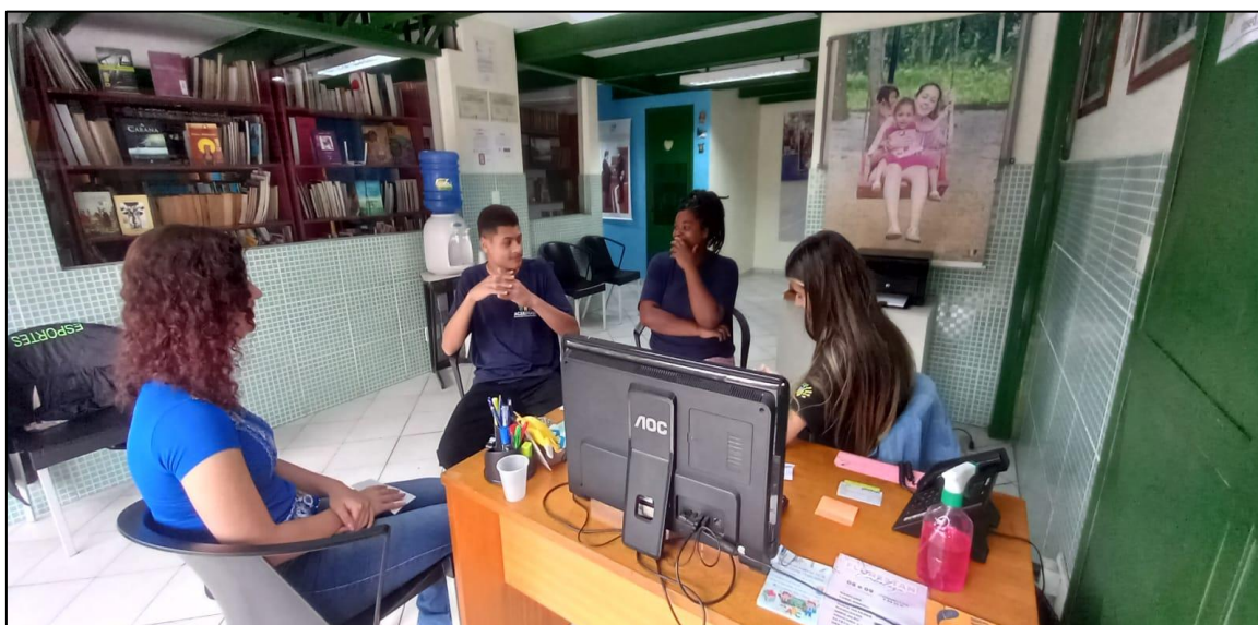
Reunião mensal recepcionistas