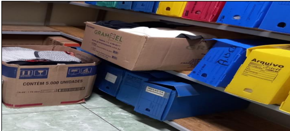
Doações feitas pela Flavia