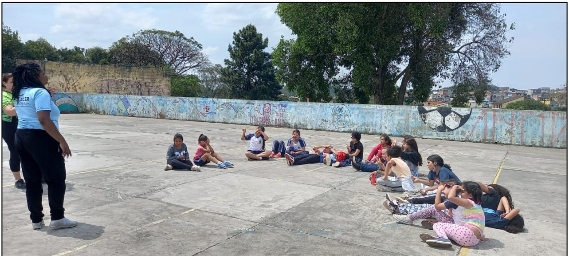
Escola José Martins