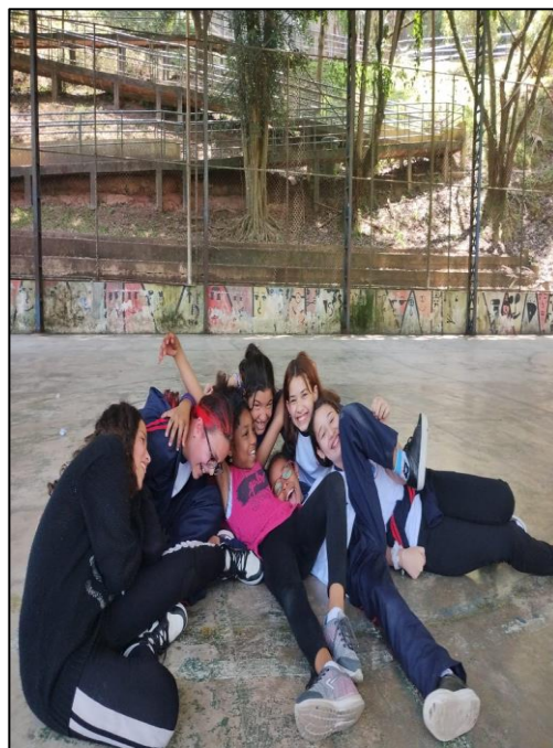
Atividade “ Identidade”