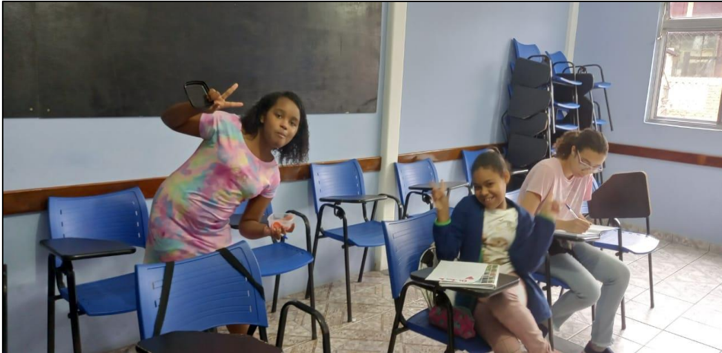
Apoio matemática e português