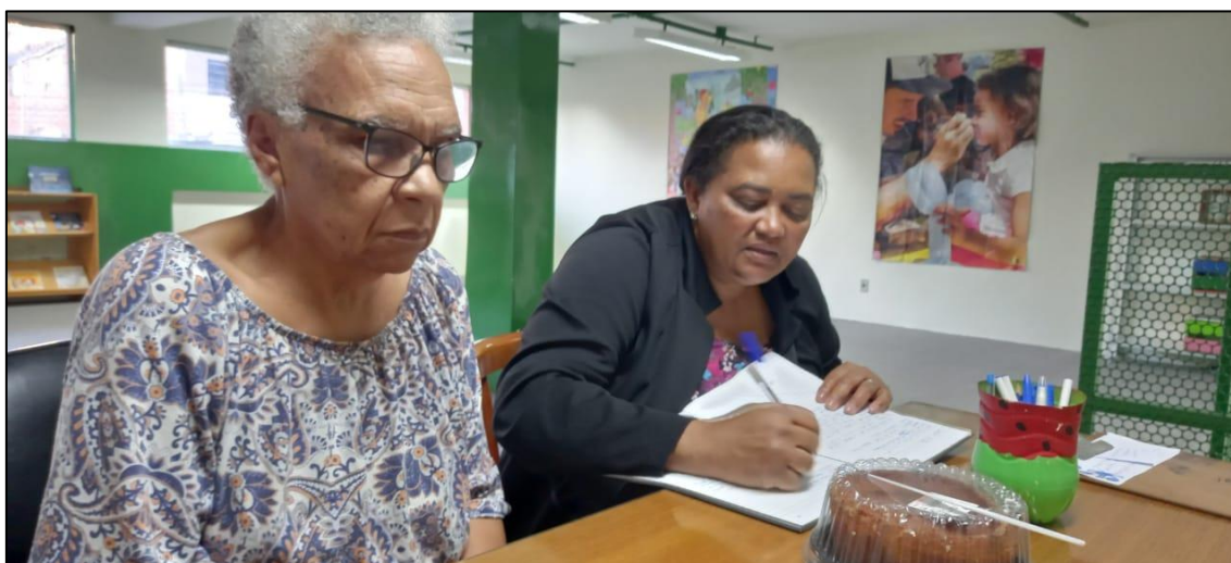
Conselho de Pais