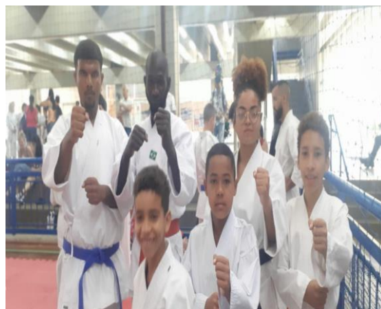
Troca de faixa e Campeonato