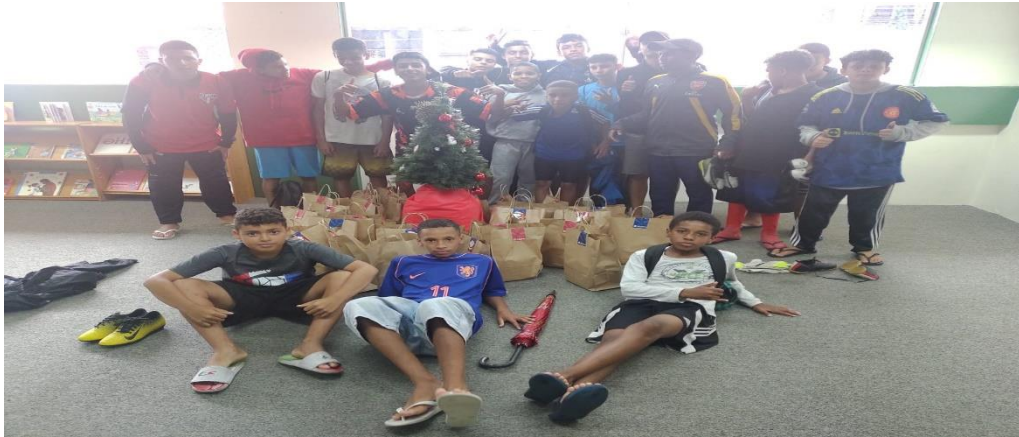
Entrega dos Panetones