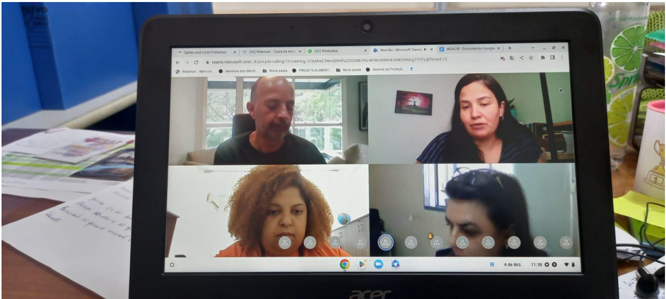
Encontro com Promotor