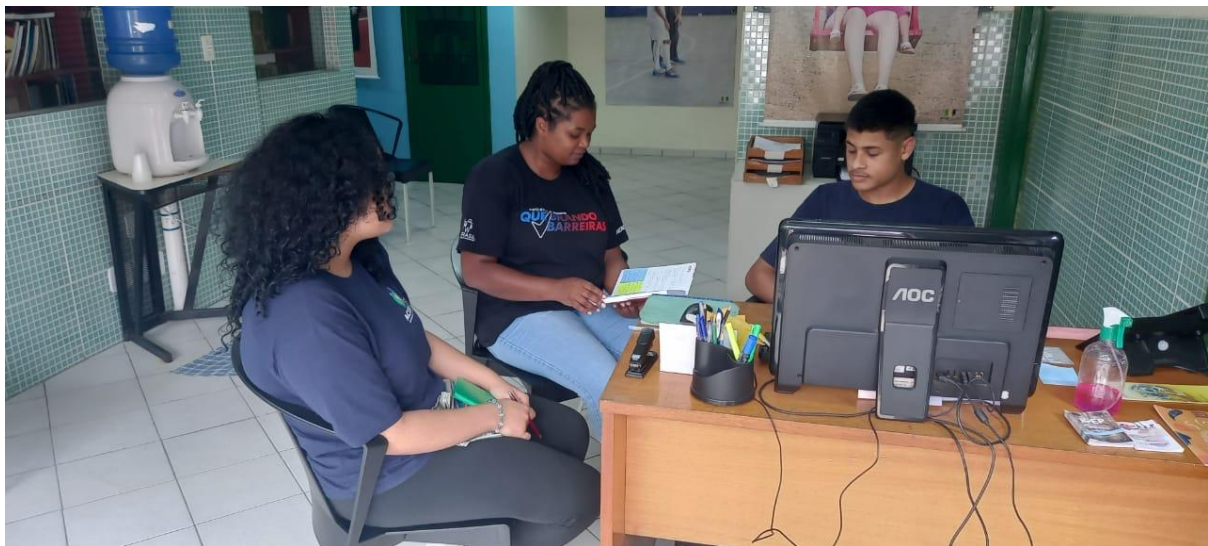
Reunião mensal recepcionistas

de proteção, feedback do mês e das ações que eles estão desenvolvendo e os pontos a desenvolver, recebeu as informações sobre a previsão dos cursos livres para ano de 2023, e informação sobre ser novamente o polo do Banco do Povo, explicar o papel da estagiária do serviço social e as atribuições que desempenha.